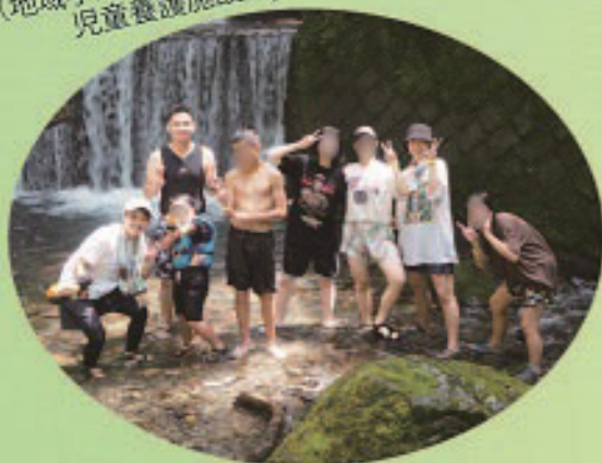
結 (地域小規模 児童養護施設)

昨年度ホームを開所し、今年で2年目になります。この1年間で新しい学校やホームでの生活にも慣れ、地域の清掃やお祭りのお手伝いに参加するなど、少しずつ地域の方々と関わることで、結ホームのことを知っていただける機会が増えてきました。こども達はアルバイトや習い事、友人関係といった各々の時間も充実させています。ホーム内でも宿泊キャンプや外食に行く等、楽しくもゆつたりとした生活を送っています。ホームに帰ってくるとその日の出来事や他愛もない話で笑い声が聞こえるような、落ち着ける場所にしていきたいと思っています。