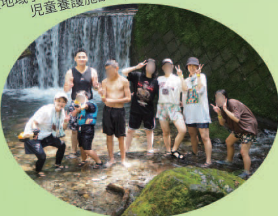
紬 (地域小規模児童養護施設)

昨年度ホームを開所し、今年で2年目になります。この1年間で新しい学校やホームでの生活にも慣れ、地域の清掃やお祭りのお手伝いに参加するなど、少しずつ地域の方々と関わることで、結・お祭りのことを知っていただける機会が増えてきました。こども達はアルバイトや習い事、友人関係といった各々の時間も充実させています。ホーム内でも宿泊キャンプや外食に行く等楽しくもゆつたりとした生活を送っています。ホームに帰ってくるとその日の出来事や他愛もない話で笑い声が聞こえるような、落ち着ける場所にしていきたいと思っています。