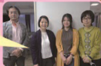
わたしたちが 児童家庭支援センターのスタッフです