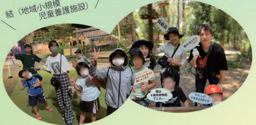
結 (地域小規模児童養護施設)

昨年度ホームを開所し、今年で2年目になります。この1年間で新しい学校やホームでの生活にも慣れ、地域の清掃やお祭りのお手伝いに参加するなど、少しずつ地域の方々と関わることで、結・お祭りのことを知っていただける機会が増えてきました。こども達はアルバイトや習い事、友人関係といった各々の時間も充実させています。ホーム内でも宿泊キャンプや外食に行く等楽しくもゆつたりとした生活を送っています。ホームに帰ってくるとその日の出来事や他愛もない話で笑い声が聞こえるような、落ち着ける場所にしていきたいと思っています。