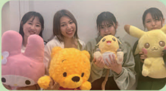
203 (ショートステイ / デイステイ)

各ご家庭の様々な事情で子育てが一時的に困難になった際、一定期間お子さんをお預かりするユニットです。2歳から小学6年生までを対象に、日中にお預かりするデイステイ、宿泊を伴いお預かりするショートステイを実施しています。今年度は元気で明るい4名の職員が担当しており、お子さんと一緒に思いきり遊び楽しい時間を共有しています。また、利用されるお子さんと保護者の方の状況やニーズを知り、不安な気持ちを少しでも解消して利用していただけるよう日々努めています。