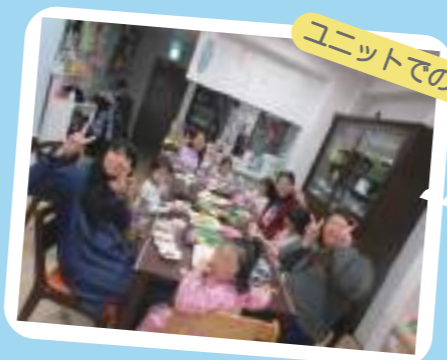
ユニットでの様子