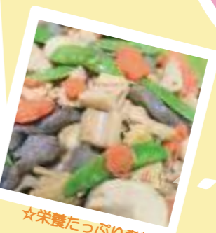
☆栄養たっぷり煮物☆

こどもたちのリクエストに 応えながら、保育士さんが買い物をし ーから料理を作っているため、 温かく、家庭的な食卓です。