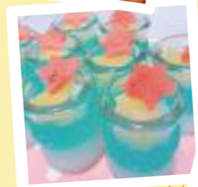
☆手作りゼリー（七夕）☆